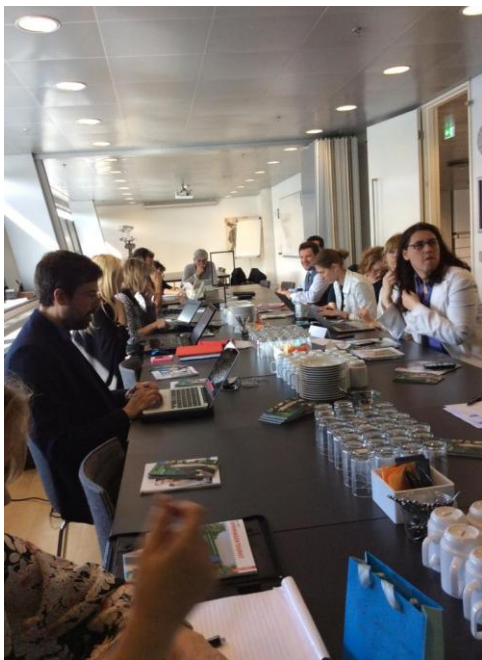
2 δύσκολες ημέρες δουλειάς