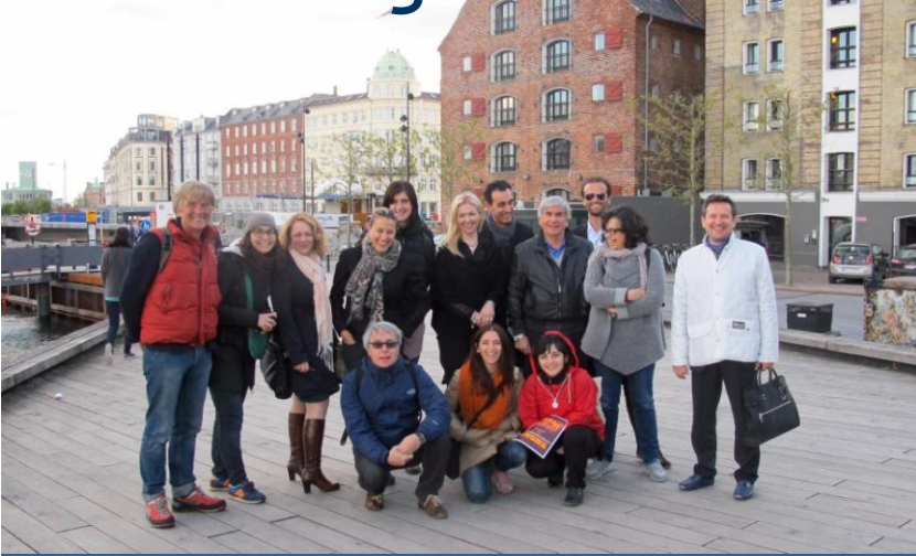
Τελευταία φωτογραφία των εταιρών στην Κοπεγχάγη