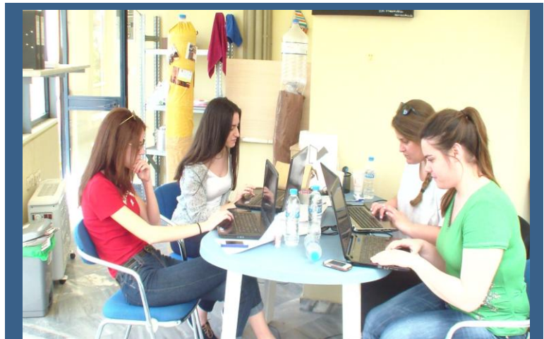
Στην Ελλάδα εθελόντριες στο γραφείο υποψηφιότητας «ΚΑΛΑΜΑΤΑ;21» δοκιμάζουν την on-line πλατφόρμα και την εφαρμογή.