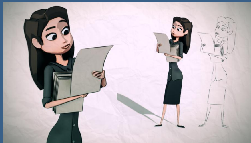
Ένας από τους 4 πρωταγωνιστές των διαφημιστικών βίντεο του ST-ART APP